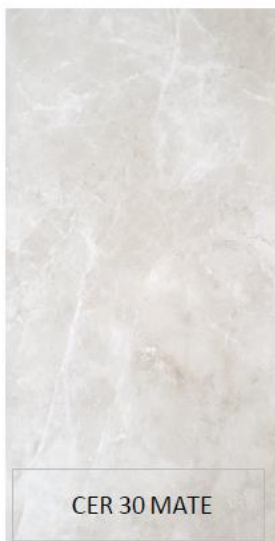
CER 30 MATE