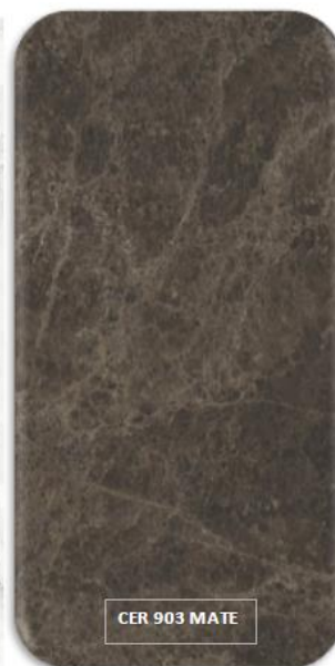
CER 903 MATE