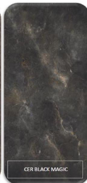
CER BLACK MAGIC