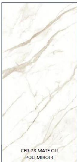
CER 78 MATE OU POLI MIROIR