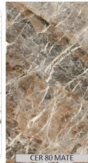
CER 80 MATE