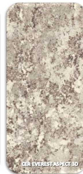
CER EVEREST ASPECT 3D