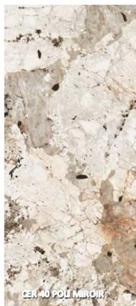
CER 40 POLI MIROIR