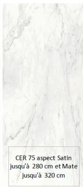
CER 75 aspect Satin jusqu'à 280 cm et Mate jusqu'à 320 cm